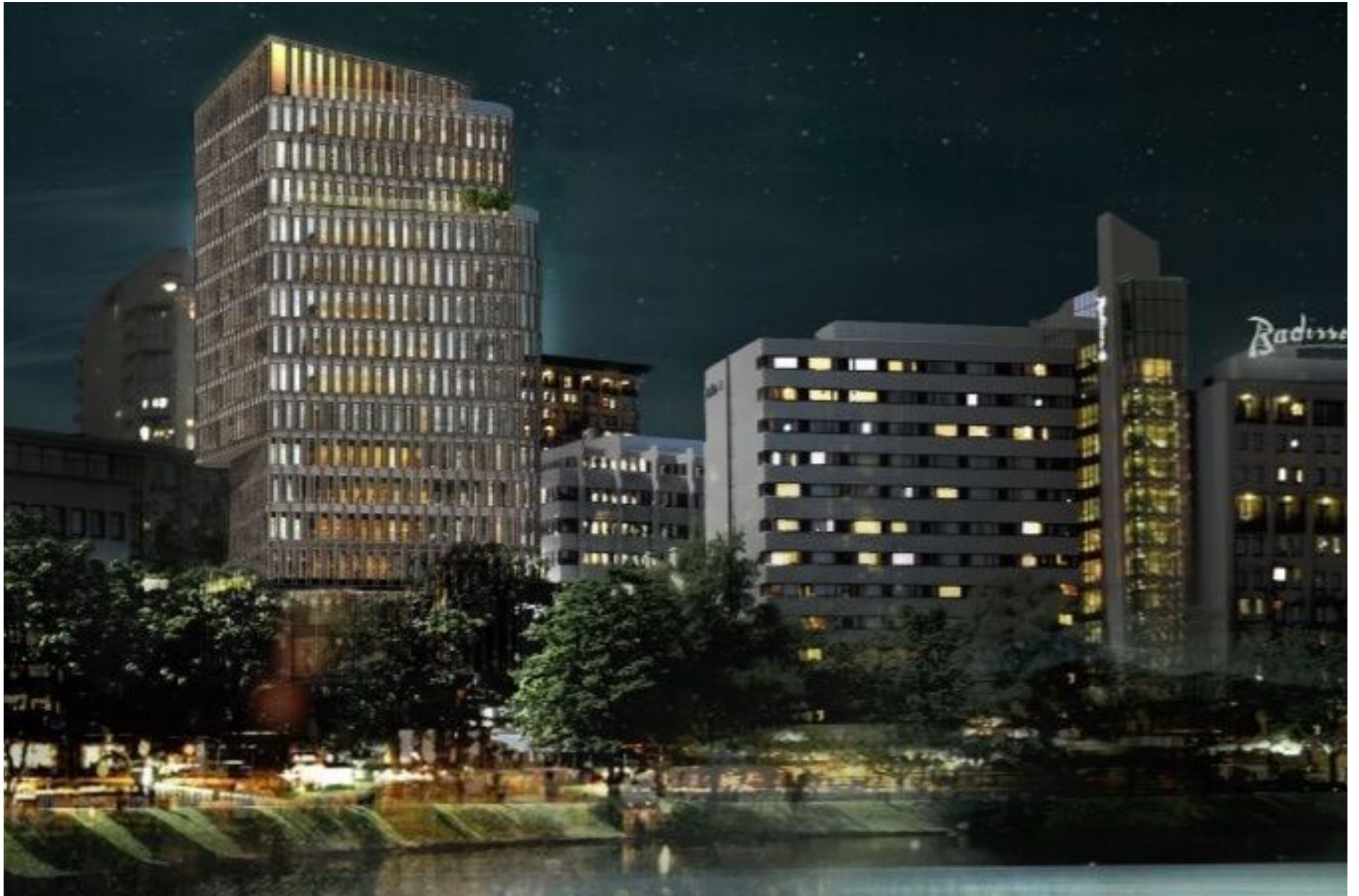
Skisse av det planlagte høyhuset i Knud Holms gate.

Grunnlagt 1. september 1893 av Lars Oftedal